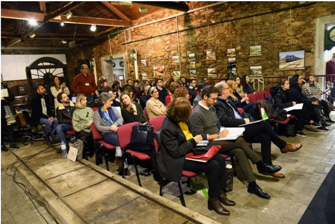
Apresentação da publicação “Ser Museu do século XXI” da Rede de Museus de Vila Nova de Famalicão.