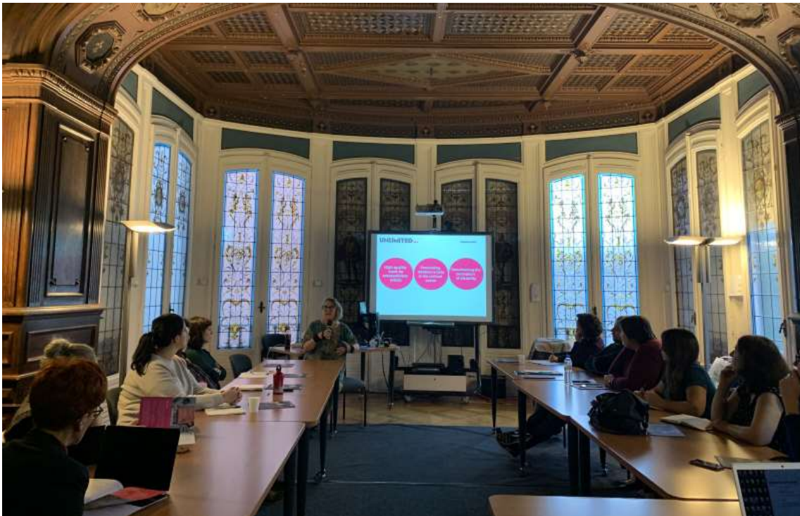
Curso “Deficiência e Gestão Cultural” no British Council.