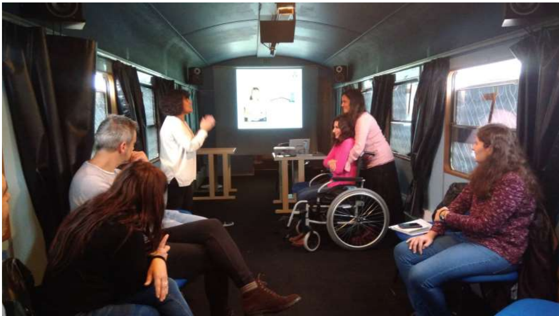
Formação interna no Museu Nacional Ferroviário

A Acesso Cultura proporcionou aos profissionais do sector cultural cursos de formação com o objectivo de fornecer ferramentas úteis e práticas para a gestão diária de questões relacionadas com o acesso – físico, social, intelectual -, assim como mantê-los actualizados em relação a estas mesmas questões.