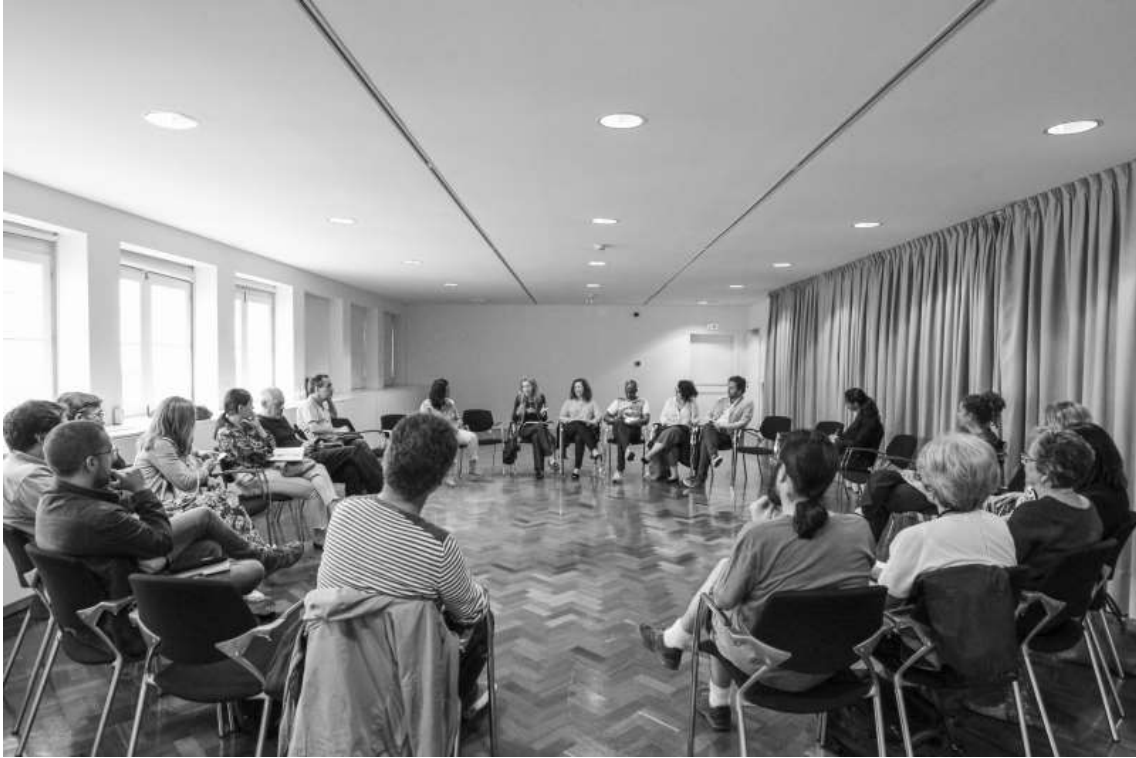
Debate no Teatro Micaelense, Ponta Delgada

A Acesso Cultura organizou quatro debates, abertos aos profissionais do sector cultural e a todas as pessoas interessadas, para podermos reflectir em conjunto sobre questões ligadas à acessibilidade – física, social e intelectual – que têm um impacto no nosso trabalho e na nossa relação com pessoas com variados perfis. Em 2019, às cidades de Évora, Faro, Funchal, Lisboa, Porto e Vila Nova de Famalicão, juntaram-se as cidades de Castelo Branco, Ponta Delgada, Angra do Heroísmo e Torres Novas. Os resumos podem ser consultados no nosso website .