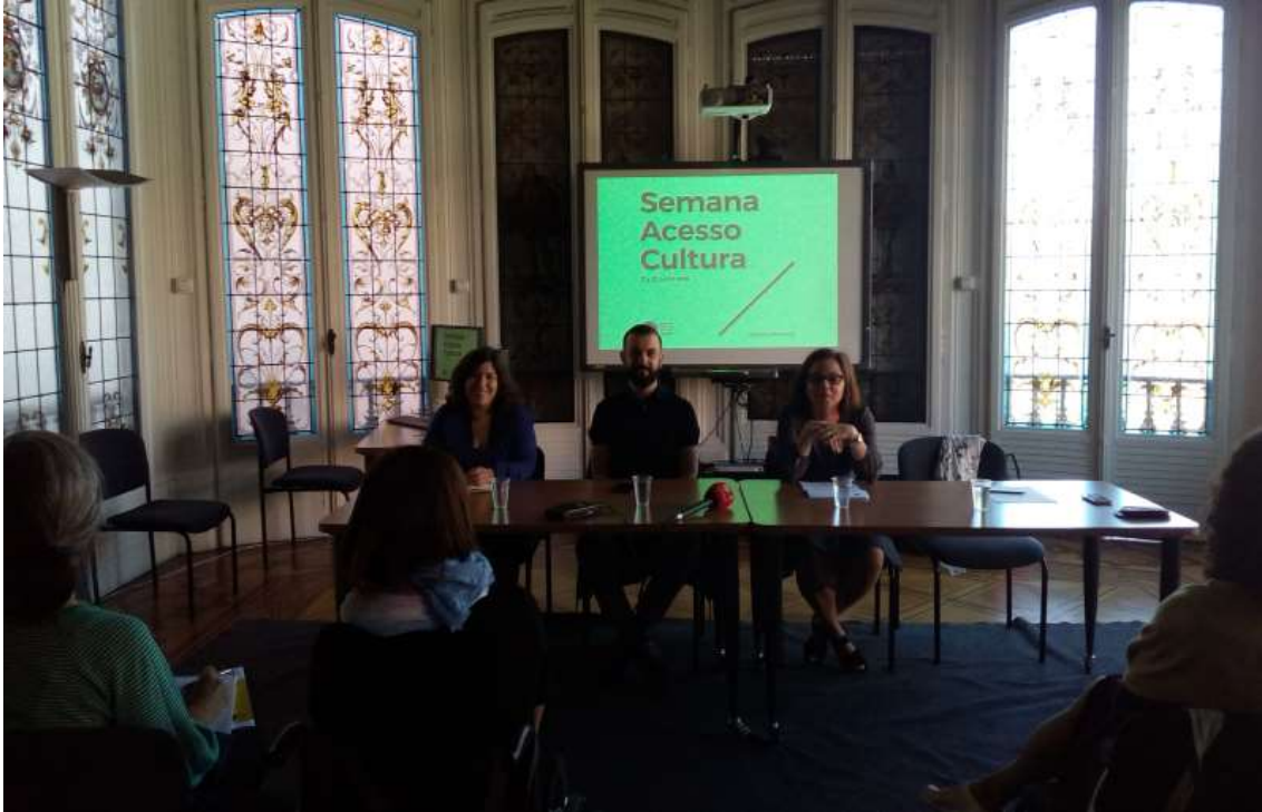
Conferência de imprensa para a apresentação da Semana Acesso Cultura 2019

A 6ª edição da Semana Acesso Cultura realizou-se nos dias 17 a 23 de Junho de 2019. Uma semana para reflectirmos em torno do que é a acessibilidade e criarmos uma maior consciência em relação à missão e objectivos da Acesso Cultura.