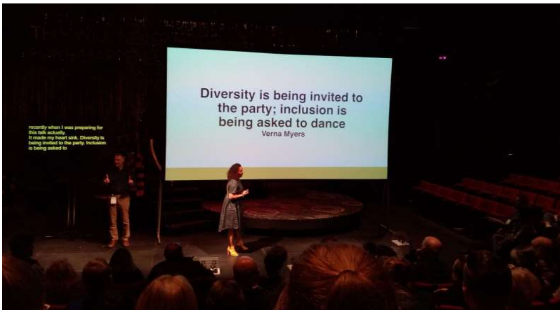
Conferência IETM, Hull