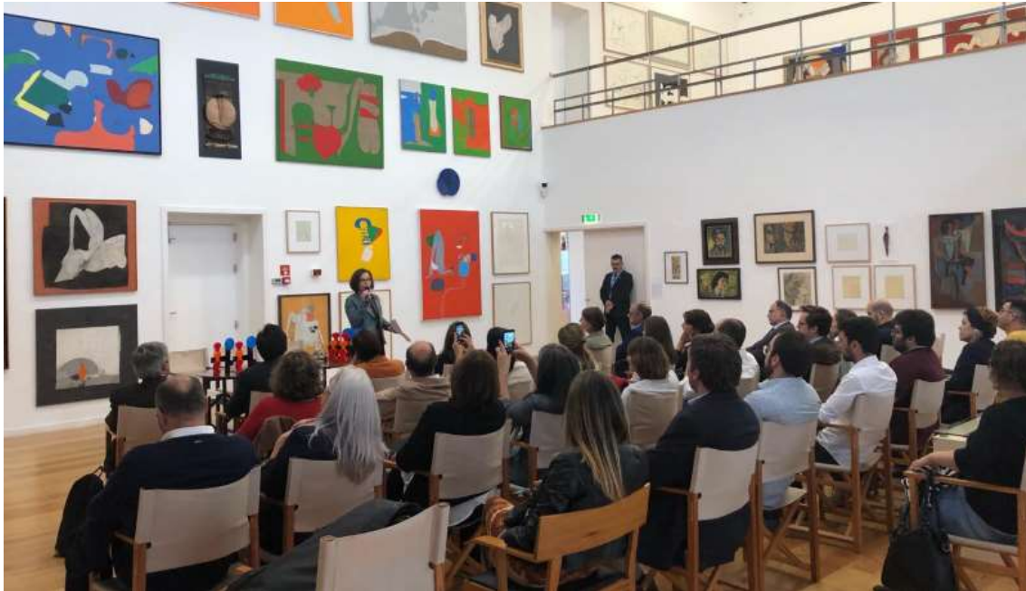
Cerimónia de entrega dos Prémios Acesso Cultura 2019

O Prémio Acesso Cultura pretende distinguir, divulgar e promover entidades (privadas, públicas, cooperativas, associações e outras) e projectos que se diferenciam pelo desenvolvimento de políticas exemplares e de boas práticas na promoção da melhoria das condições de acesso – nomeadamente físico, social e intelectual – aos espaços culturais e à oferta cultural, em Portugal. Pretende ainda criar exigência junto dos públicos, com vista à melhoria da acessibilidade, assumida como um todo.