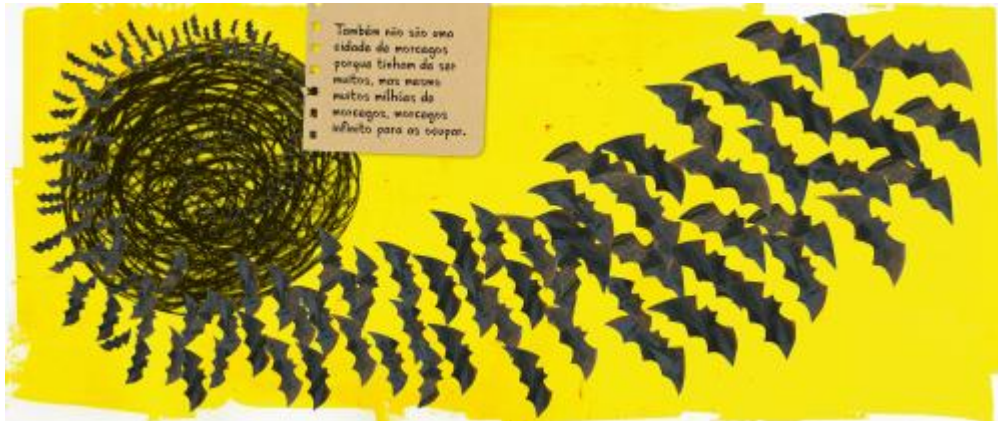
Seleccção de imagens